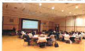
高齢者虐待防止研修会