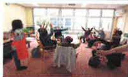
送迎付き介護予防教室(里湯ちりはま)