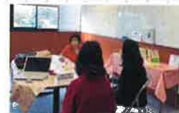
ほっとカフェ～オレンジの輪～(アステラス)

認知症のある人や家族、支援する人が参加して話し合い、情報交換する場として、ほっとカフェ(認知症カフェ)を開催し、介護している家族や本人を応援します。