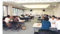
区長・民生委員との福祉座談会

暮らしやすいまちを目指し、医療機関やサービス事業所、民生委員などの関係機関と連携し、必要なサービスを提供します。