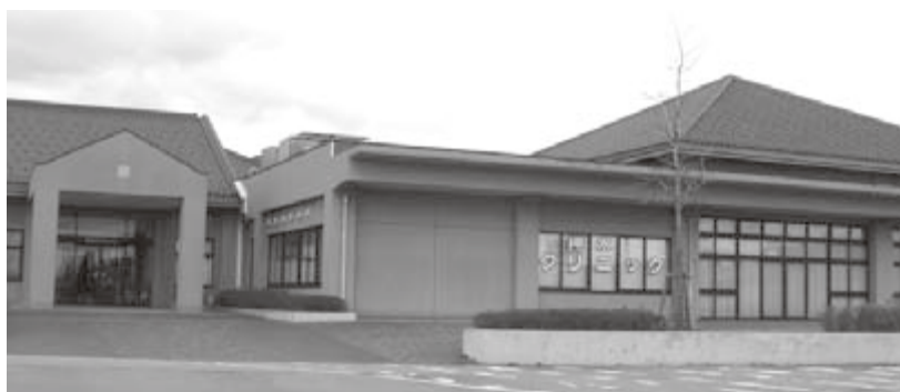
診療時間が午前中のみとなった押水クリニック

【問】中山間地では町道が多く、安全施設まで負担金を取るのは、安全対策としてはどうか。