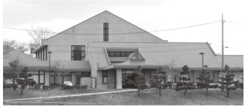
宝達志水町商工会の事務所が移転したネクサス