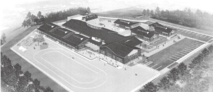
相見保育所完成予想図

答民間委託になっても、地産地消のため、宿にある特産市場や二口のチンゲンサイなどを使用している。