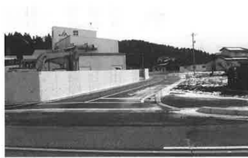
国道159号線に接続した町道子浦散田線