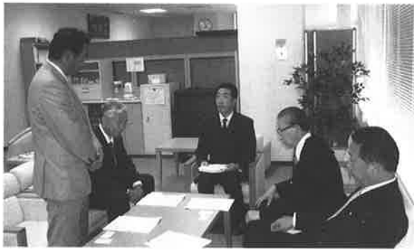
全国町村議会議長会にて

国における地方自治体関連法案の改正に向けた取り組み、全国の町村議会の動向など、最新の情報を収集することができ、課題への取り組みに大いに参考となりました。