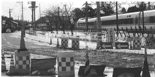
敷浪駅付近の道路整備工事