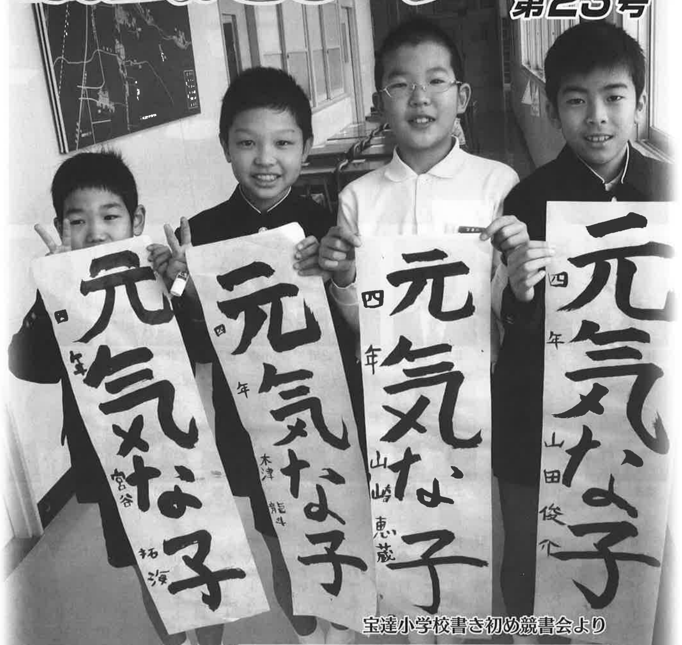
宝達小学校書き初め競書会より