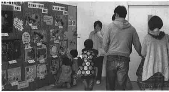
アステラスでの作品展示

問 町が申請するのは親族のいない方の場合。親族がいる方は、各々で申請しているので町では把握していない。