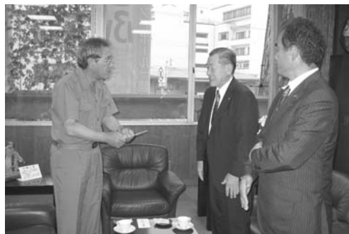
◀ 左から中島副市長、津田町長、北本議長

8月23日、下呂市（岐阜県）で大雨の影響により、床上・床下浸水、土砂崩れ等の被害が多数発生しました。