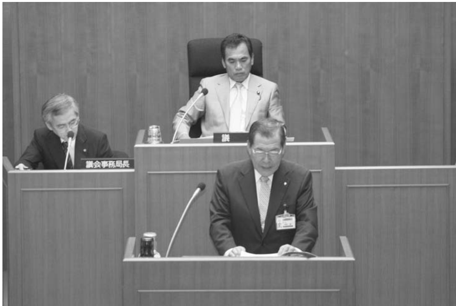
提案理由説明を行う津田町長

津田町長は提案理由のなかで、統合中学校の建設について、これまでの検討結果を踏まえ、総合的に判断した結果、押水中学校用地が適当であるとし、基本設計委託料の計上を説明しました。