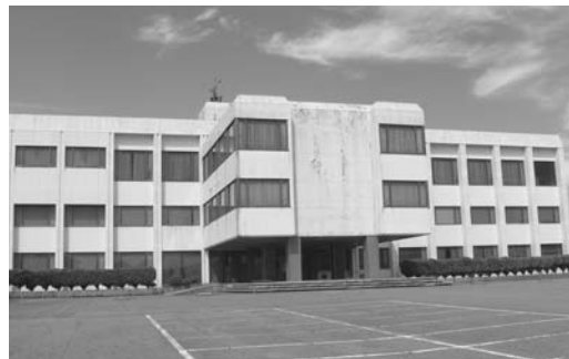
売却が決まった旧押水庁舎跡地

○財産の処分について (旧押水庁舎跡地) ・社会福祉法人こうけん会 ・4500万円 (全員賛成)