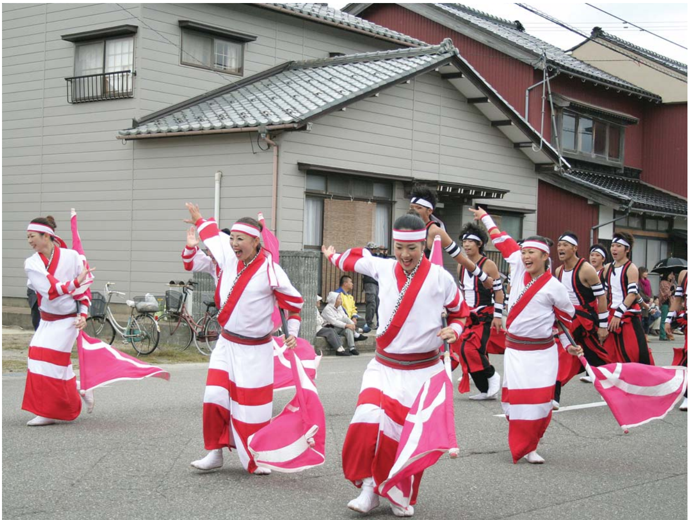
第12回YOSAKOIソーラン日本海本祭（審査パレード演舞）