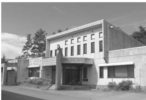
廃止町有施設の白虎山センター

①売却準備が整ったものを順次売り払いしている。今回、物件8件を公募し、3件に購入申し込みあり。旧加能繊維工場跡地と旧押水森林組合跡地については申し込みなし。両跡地とも、継続して土地と建物を一括して売却したい。旧加能繊維工場跡地は、柳瀬第二工場適地として、県とも