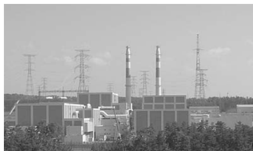
▲志賀原子力発電所