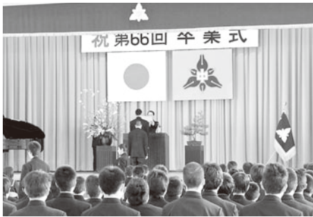
志雄中学校卒業式より

答 学校教育課長 ① 平成27年3月31日、押水中学校、志雄中学校が、その歴史に幕を閉じることになる。その思い出として、校歌のCDを資料として残り、新しく開校する宝達中学校や町立図書館で、貸し出し出来るよう取り組みたい。 卒業生に対する配慮として、先進事例を参考とし、平成25年度に、中学校統廃合準備委員会で取組み内容等の協議をお願いし、例えば実行委員会を立ち上げ、学校の歴史の記念となる資料を納めたものの作成などの検討をお願いしたい。