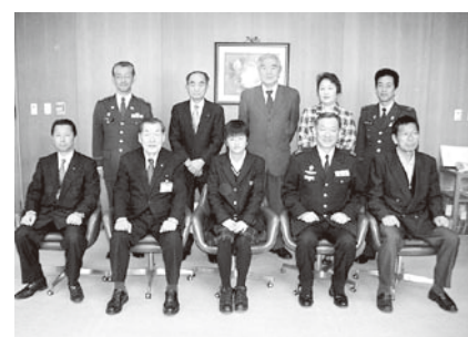
町自衛隊入隊予定者激励会