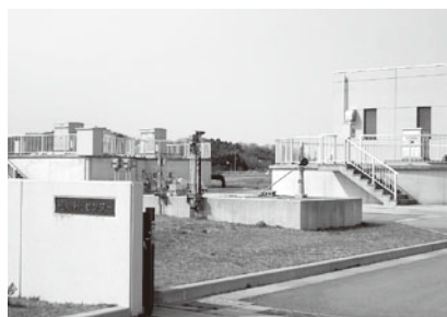
樋川浄化センター