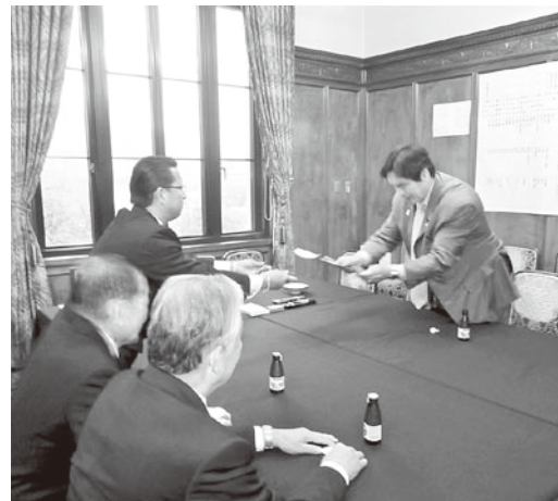
国会議事堂にて馳浩議員に要望書を提出