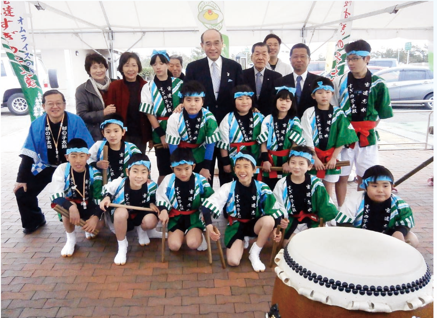
すぎの子太鼓 《能登有料道路無料化記念イベントより》