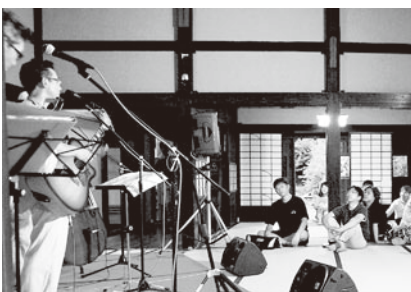
蔵コンサート in 岡部家より