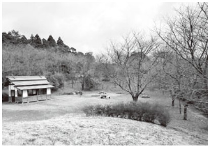
志乎・桜の里古墳公園

答 公園全体の剪定作業は単年度では不可能。継続的に行い適正な維持管理に努めたい。