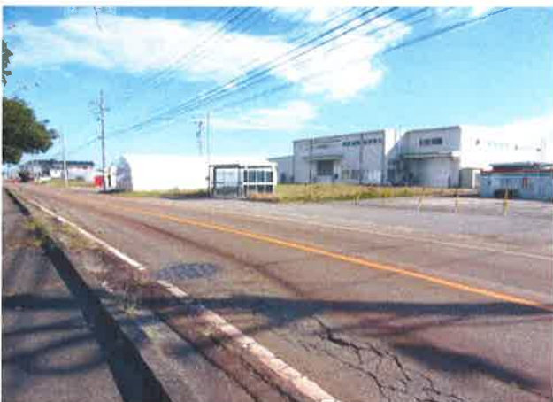
⑤南部育苗センター前