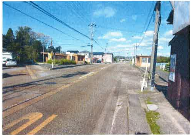
参考・北川尻国道沿い（バスベイあり）