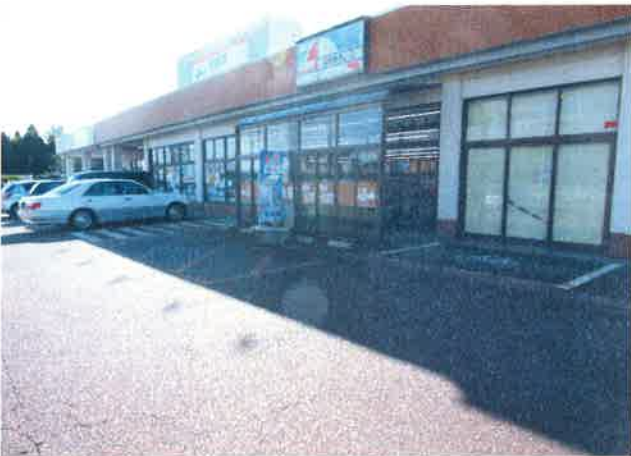
⑮生鮮館ちゃれんじ前