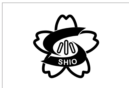
▲モノクロ縮小表示