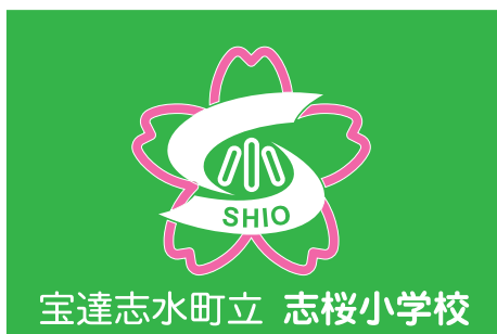
▲校旗&バッジ等縮小表示