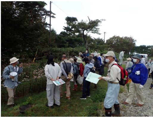
アサギマダラに関する活動紹介