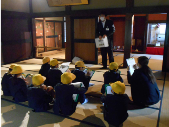
押水第一小学校の見学対応(10月17日)

5月には主屋(指定外部分)のふすまの張り替え、7月には敷地内(ポンプ小屋付近)の樹木の枝打ちを実施した。3月には、主屋の床下に動物避けの格子柵を設置する予定である。