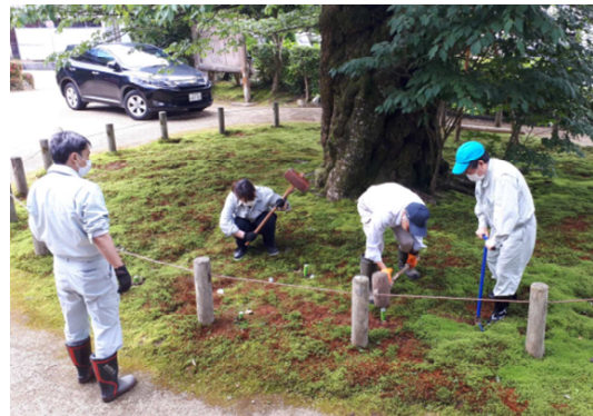
ゼンジョウジキクザクラの施肥作業

6月には県指定天然記念物 ゼンジョウジキクザクラの施肥作業を実施した。令和5年3月には、末森城跡本丸の説明看板を更新する予定である。