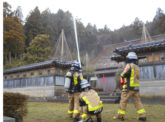
岡部家文化財防火訓練(1月22日実施)