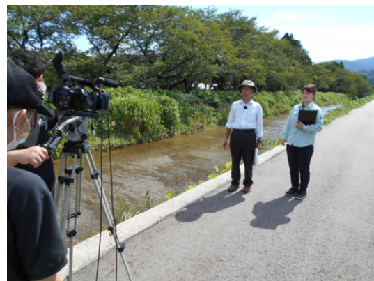
ケーブルテレビ撮影(8月)