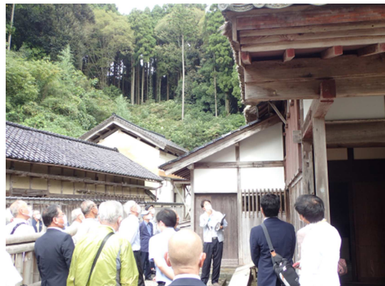
文化財視察研修(岡部家)