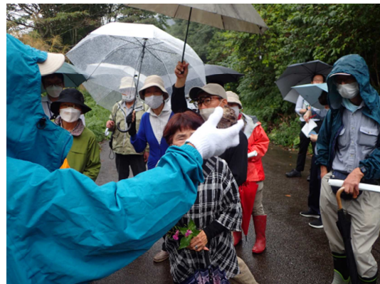
地質と鉱物に関する説明