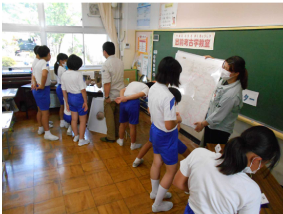
考古学出前教室(宝達小学校)