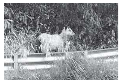
▲町内に出没したカモシカ