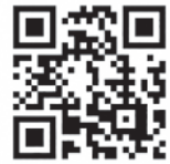
▲羽咋病院ホームページ