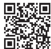
▲応募専用フォーム