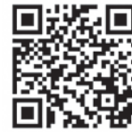
▲奨学金返還支援金貸与制度のご案内

公立羽咋病院 総務課(TEL 0767-22-3307) URL： https://www.hakuihp.jp/