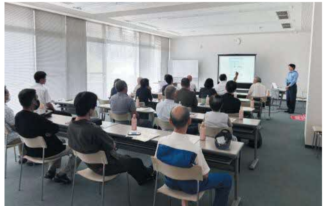
▲誘導研修のようす