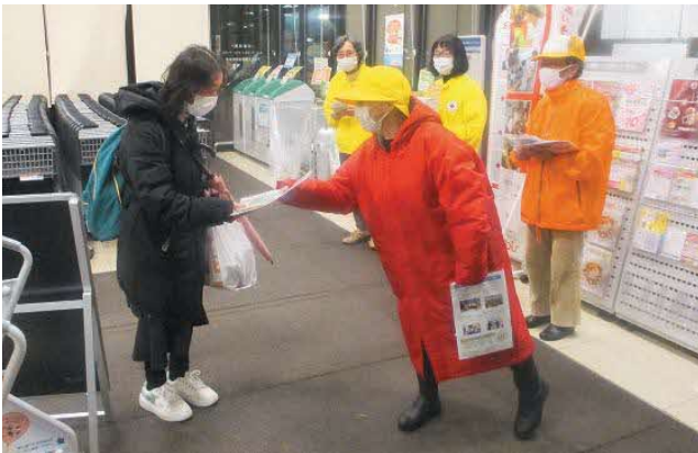
▲交通安全運動のようす