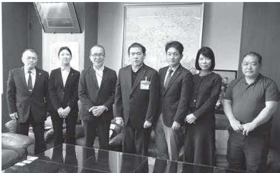
▲防災講座関係者の皆さん