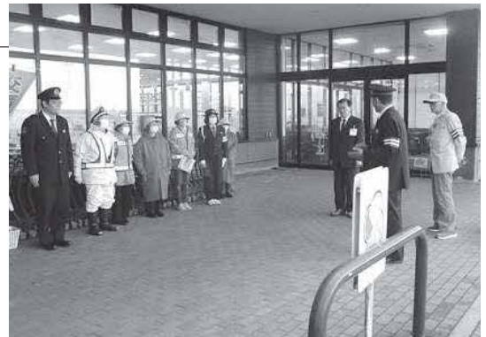
▲街頭キャンペーンに参加した皆さん

今後も交通事故のない安全・安心なまちづくりを目指し、関係機関と連携しながら交通安全活動を推進していきます。