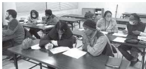
▲にほんごきょうしつのようなようす

日本語教室でボランティアをしませんか。宝達志水町と羽咋市では合同で、地域で暮らす外国人住民のための日本語教室を実施しています。日本語を教えたり、日本での生活をサポートする活動を支えてくださる人を募集しています。ぜひ一度教室をのぞいてみてください。