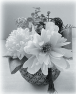
サイズ：高さ約20cm×幅約14cm ※写真はイメージです。