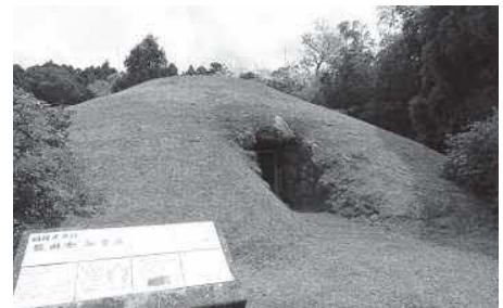
▲国指定史跡 散田金谷古墳