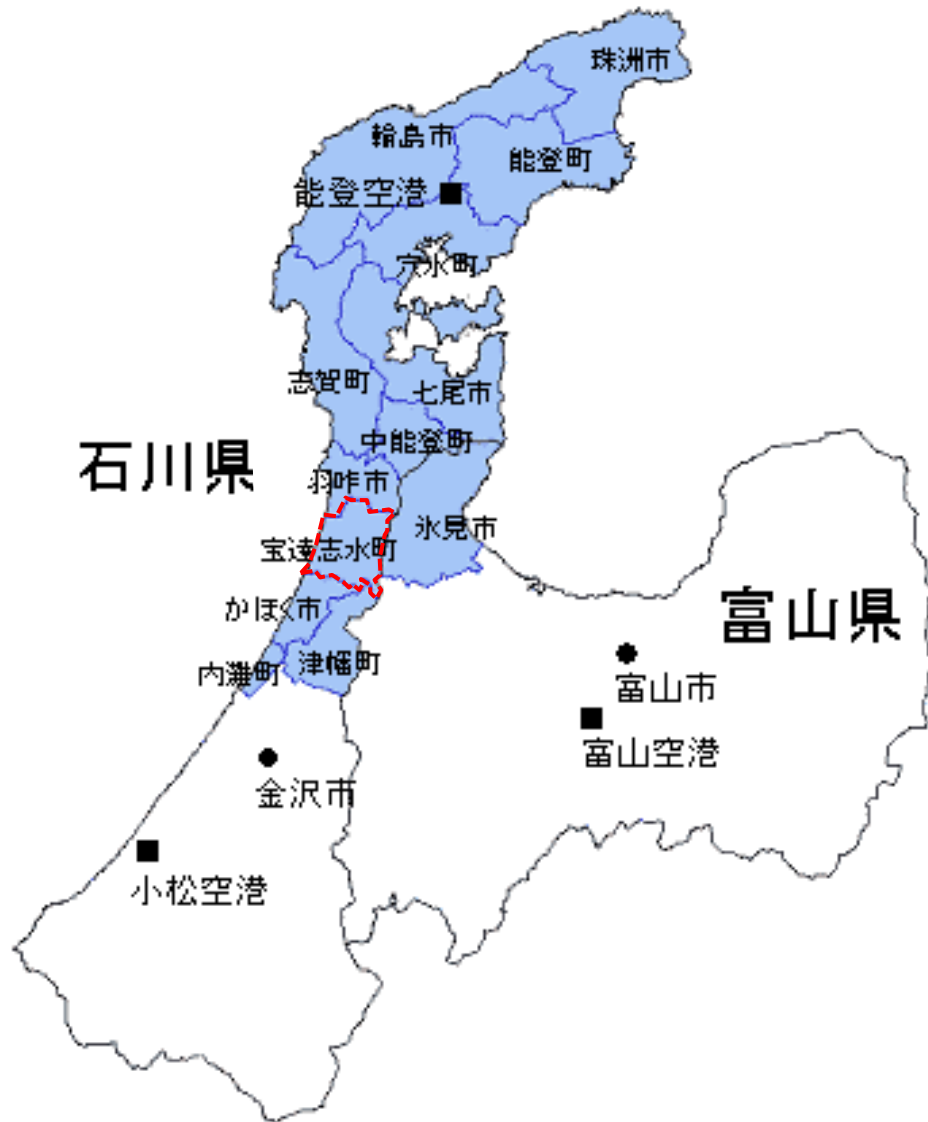
(表5 別添) 半島振興法上の石川県内交通不便地域