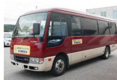
コミュニティバス