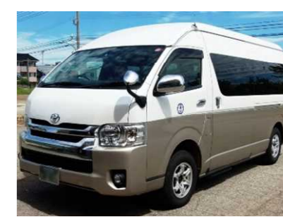
南北シャトル（イメージ）