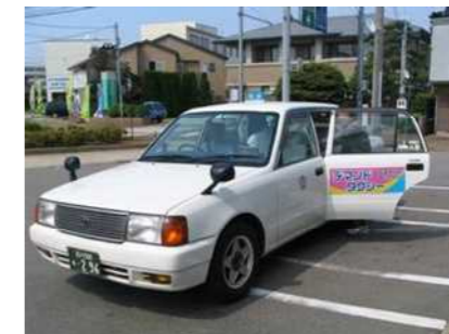
デマンドタクシー