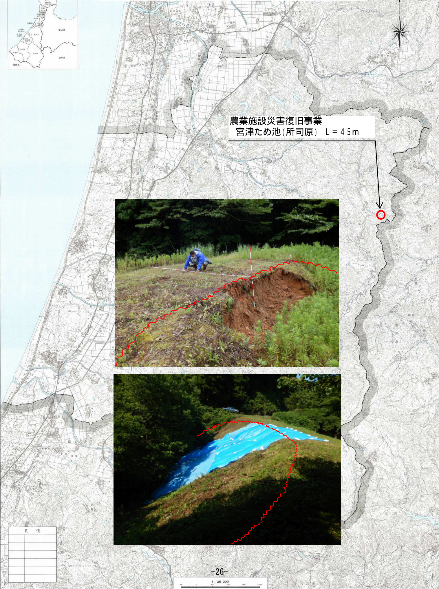
農業施設災害復旧事業 宮津ため池(所司原) L = 45m