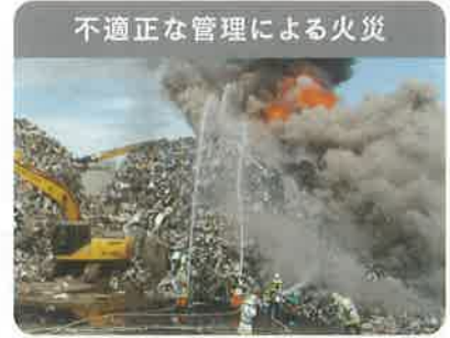
不適正な管理による火災

環境対策を行わずに廃家電を破壊することで、フロンガスや鉛などの有害物質が環境中に放出されます。